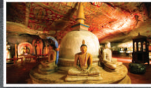
அபயகிரி மகா தூபி