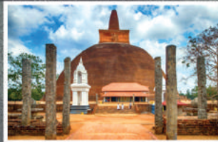
අභයගිරිය මහා ස්ථූපය