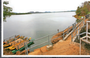
ரன் தெனிகலை அணைக்கட்டு